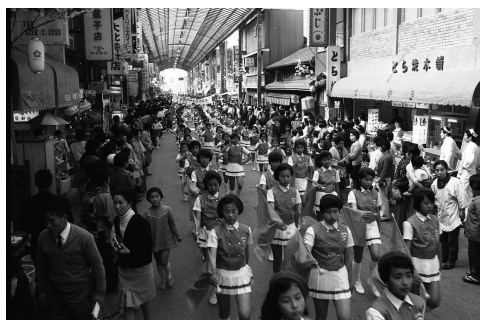
大阪万博の岸和田駅前パレード

最近、岸和田では岸和田を舞台としたNHKの連続ドラマ「カーネーション」が、話題にのぼる。その撮影風景の中に、町かどにわざわざ木製のごみ箱がセットの一つとして設置されていたという情報を得た。(註3)やはりNHK的にみても、岸和田の町かどにはごんばこは無くしてはならない舞台装置なのだということがわかり、岸和田の特徴をよく捉えているなという安心感を覚えた。