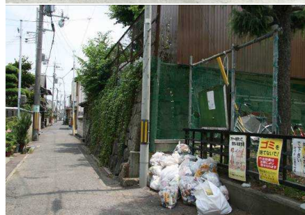
上、昭和30年代 下、平成22年