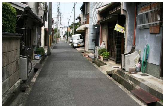
岸和田市中町 ごんばこ密集地域

たとえば古い町並みが残る、京都市、奈良市内では一切見かけることができない。東京の荒川区、台東区、墨田区などという下町風情の残る町でも筆者が踏査を行った限り、生存例は見られなかった。地方都市では会津若松ではバスに乗っていた中で、道ばたで1基見かけたのみであった。