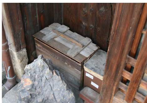
木製転用型ごんばこ

りんご箱などを転用し、最も容易に設置されたものである。しかし、容易であるがために容易に消滅し、現在市内では紀州街道の本町で1件の使用例が認められるのみである。非常に貴重な例である。