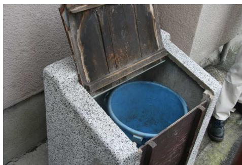
ポリペールとごんばこの協働例