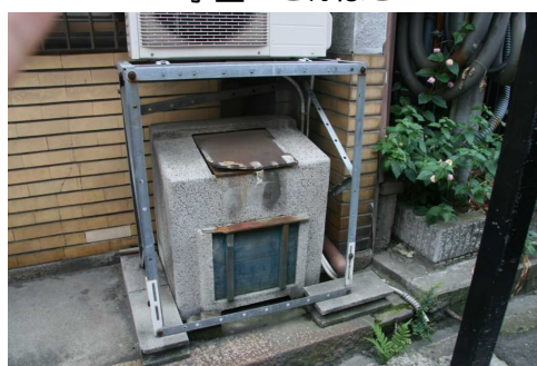
小型 ごんばこ バリエーション例