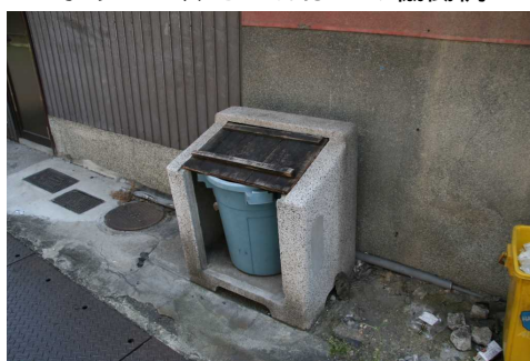
ポリペールとごんばこの相互扶助